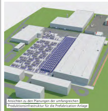
Ansichten zu den Planungen der umfangreichen Produktionsinfrastruktur für die Prefabrication-Anlage