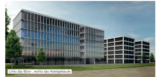
Links das Büro-, rechts das Hotelgebäude